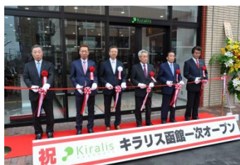
オープニングセレモニーの様子