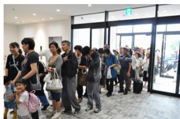
多くのお客様にご来店いただきました