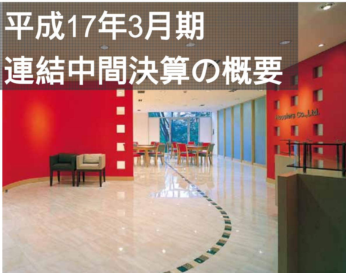
本社ロビー(千代田区紀尾井町3-3)