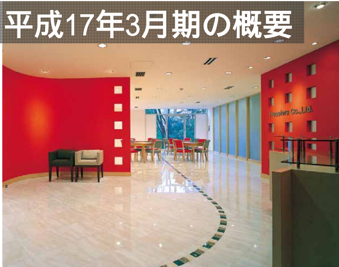
本社ロビー(千代田区紀尾井町3-3)