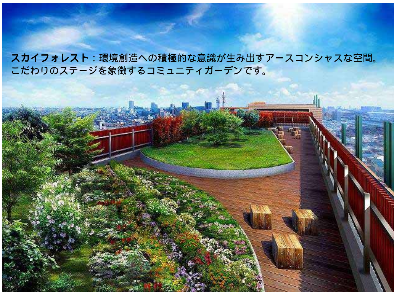
スカイフォレスト：環境創造への積極的な意識が生み出すアースコンシャスな空間。こだわりのステージを象徴するコミュニティガーデンです。