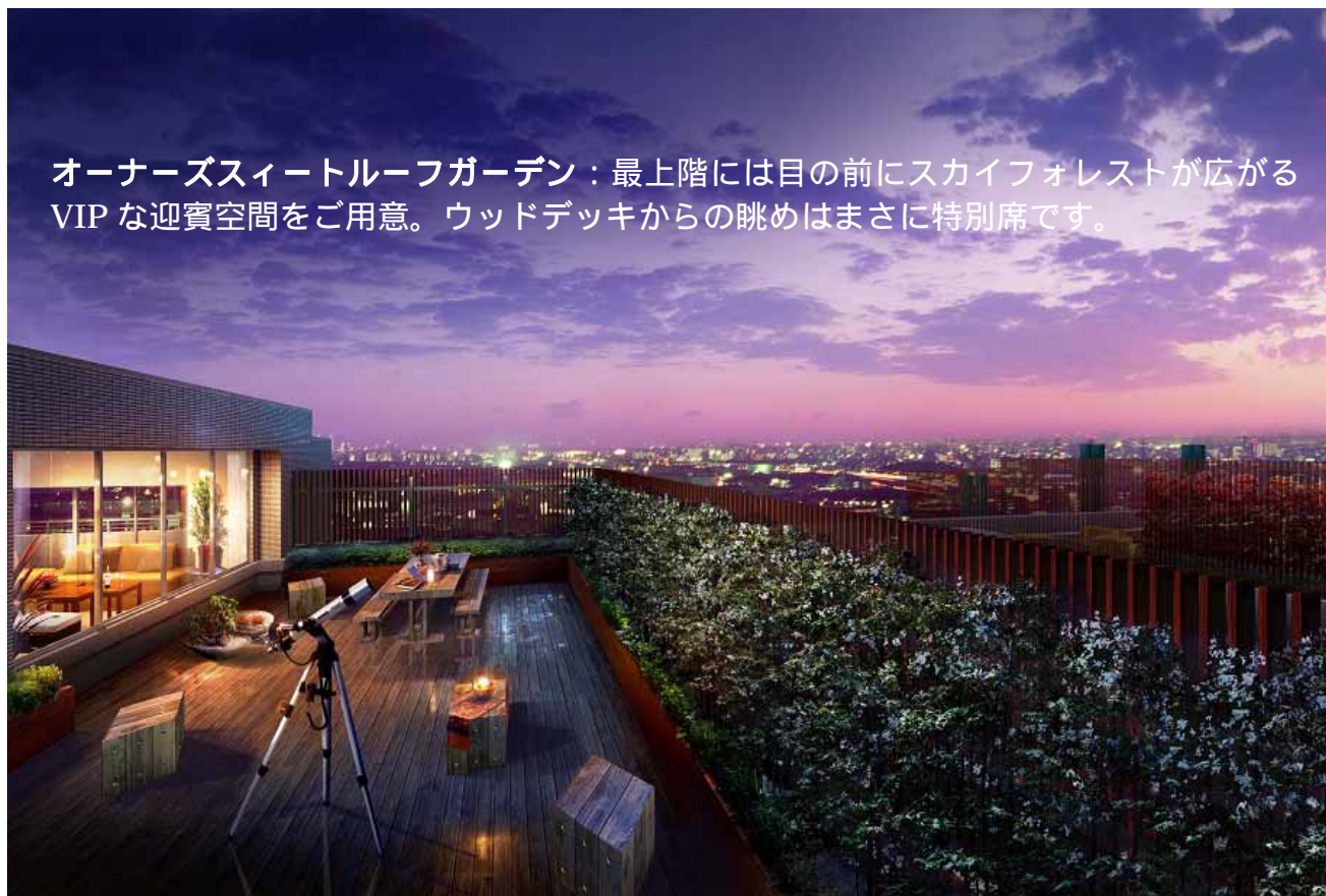
オーナーズスイートルーフガーデン：最上階には目の前にスカイフォレストが広がるVIPな迎賓空間をご用意。ウッドデッキからの眺めはまさに特別席です。