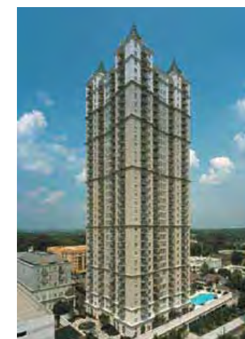
Mayfair Renaissance Atlanta, GA