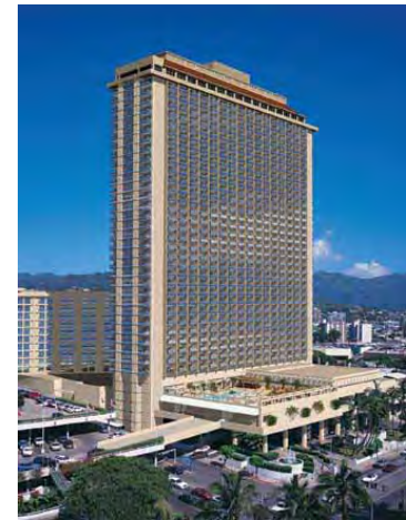
Ala Moana Honolulu, HI