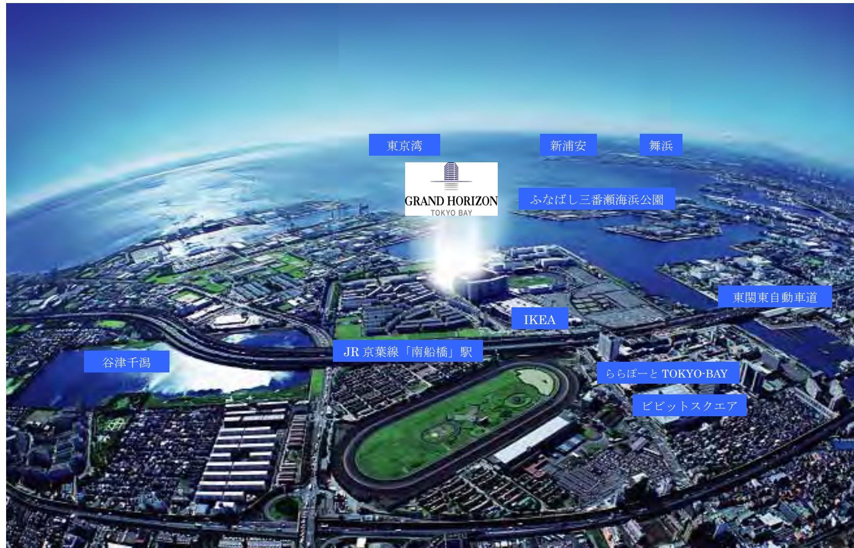
ビビットスクエア (徒歩 12分)

アミューズメント&カルチャーの発信地として注目を集めつづける東京ベイエリア。その一角に位置する「南船橋」は、お台場や舞浜と並ぶ人気スポットです。JR 京葉線で都心とも軽やかにつながるこの街は、ショッピングやエンターテイメント、グルメなどが充実、さらに、「谷津千潟」や「三番瀬」をはじめとした、豊かな自然も身近。いろとりどりの魅力が集うこの街は、毎日の楽しみを自在にコーディネートできます。