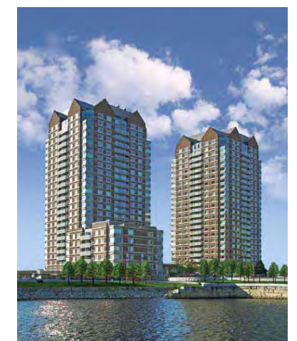
Reqatta Riverside Cambridge, MA