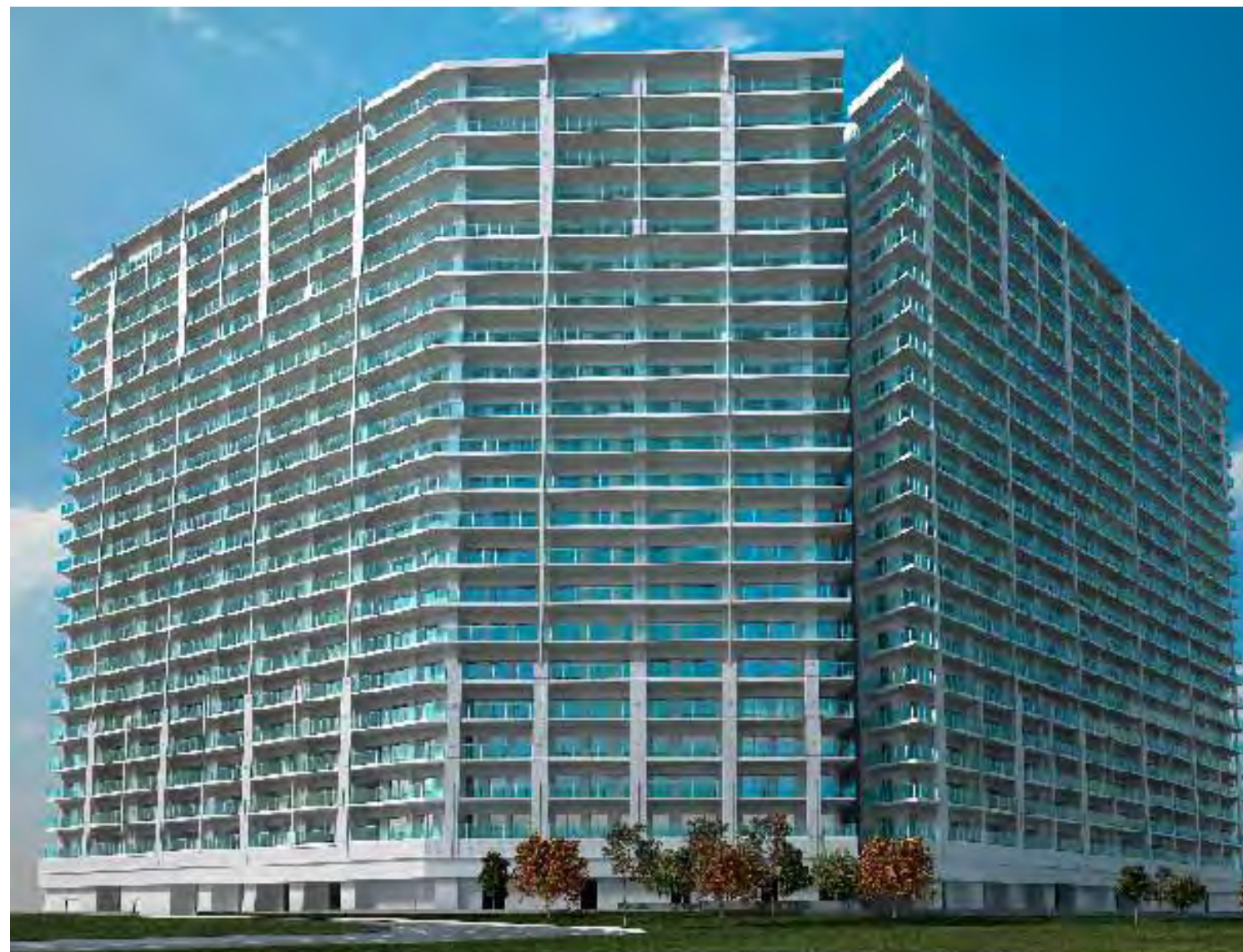
※すべて完成予想図

株式会社フージャースコーポレーション（本社：東京都千代田区、代表取締役：廣岡 哲也、証券コード：8907）は、千葉県船橋市において、「GRAND HORIZON TOKYO BAY」総戸数 684 戸のセールスパビリオンを 2月10日オープン 、 3月下旬 より販売を開始する予定といたしますのでお知らせいたします。