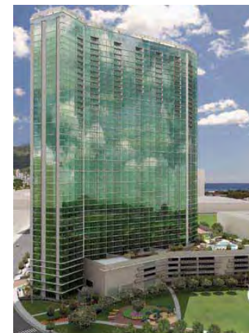
ko'olani Honolulu, HI