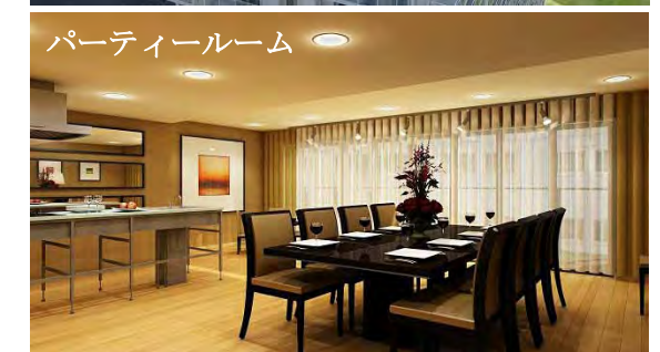
パーティールーム