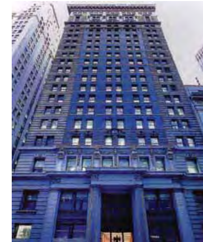
Eexchange New York, NY